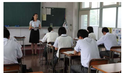
7月20日 3年生を対象に 就職準備講習を行いました

では、「監督を結果で見返してやろう」と普段の練習から死にもぐるので必死に声を出し、必死にプレーをし続けました。その結果、再びレギュラーとして試合に出させてもらえました。何が言いたいかというと、「逆境に強く生きてほしい」と言うことです。生きていく上で自分の思い通りにならないことがほとんどです。人間の本性が出るのは逆境に遭遇した時だと思ひます。そんな時、「くそつ、絶対認めさせてやる」「絶対結果を出してやる」と思える人になってほしいです。楽を求めたら、苦しみが待っています。その行動が運命を変えます。(渡邊康介・わたなべこうすけ・学習支援員)